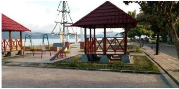
Gambar 9. Taman Pantai Air Salobar