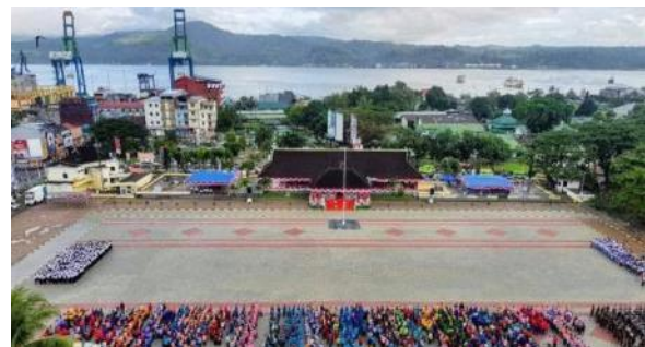
Gambar 1. Lapangan Merdeka

Monumen dr. Johannes Leimena yang diresmikan pada tahun 2012 oleh Presiden SBY menempati tempat kedua dalam survei dan diikuti oleh Ruang Terbuka Publik Amahusu Beach atau yang lebih dikenal dengan Pantai Amahusu di tempat keempat.