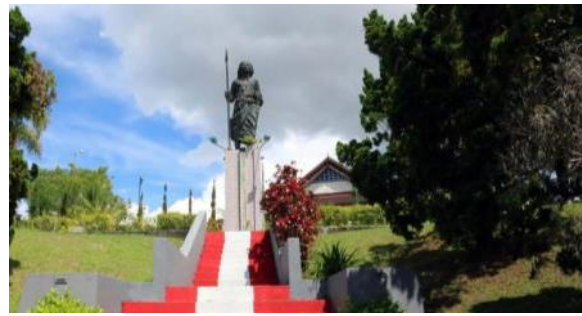
Gambar 12. Monumen Martha Ch. Tjihahu