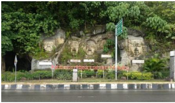
Gambar 16. Pahlawan Nasional dari Maluku

Pertama , daya tarik visual ruang publik. Pada umumnya, ruang publik di Kota Ambon (Tabel 1) telah memiliki daya tarik masing-masing baik itu buatan maupun alami yang dipadukan dan menjadi daya tarik khas di tiap lokasi. Namun pada beberapa ruang publik, dijumpai hal tertentu yang justru menambah ketertarikan kaum milenial untuk berkunjung. Misalnya Taman Pattimura yang memiliki Patung Pattimura, Air Mancur, lampu dan tanaman hias. Atau Pantai Amahusu dengan sunset yang dapat dinikmati dan diabadikan.