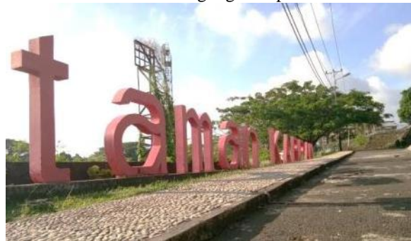
Gambar 14. Taman Karpan

Taman Karang Panjang dan Lapangan Mandala yang terletak saling berdekatan menempati urutan kesembilan dan kesepuluh dalam survei. Dalam sebulan terakhir, Taman karang panjang dikunjungi tujuh responden dan Lapangan Mandala dikunjungi oleh enam responden. Urutan terakhir dalam survei ditempati oleh Monumen Pahlawan Nasional dari Maluku yang dalam sebulan terakhir tidak dikunjungi sama sekali oleh responden.