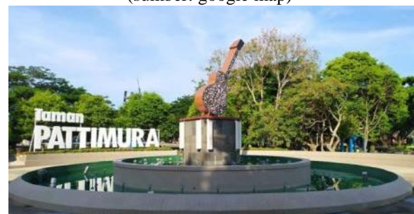
Gambar 2. Taman Pattimura