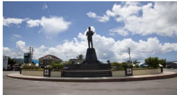
Gambar 6. Monumen dr. Johannes Leimena

dikunjungi oleh 14 responden dalam sebulan terakhir.