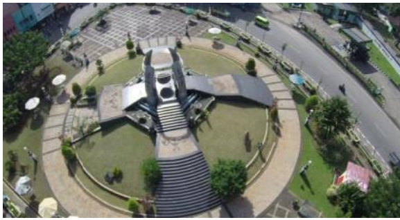
Gambar 3. Gong Perdamaian Dunia