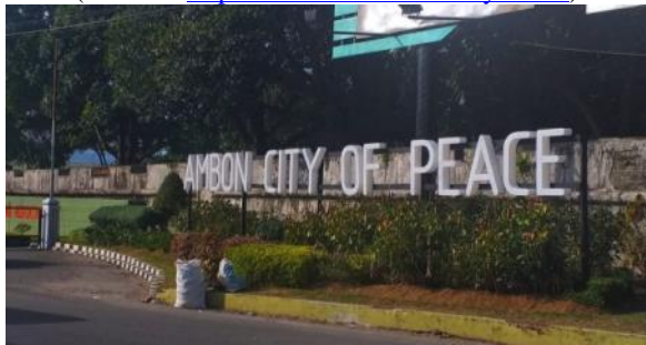
Gambar 4. Landmark Ambon City of Peace

Dalam sebulan terakhir, Monumen dr. Johannes Leimena dikunjungi oleh 24 responden dan Pantai Amahusu yang direvitalisasi oleh Dinas PUPR Kota Ambon sejak tahun 2019 serta diresmikan Wali Kota Ambon pada 1 Februari 2020 bertepatan dengan launching Ambon Visit 2020 dikunjungi oleh 23 responden.