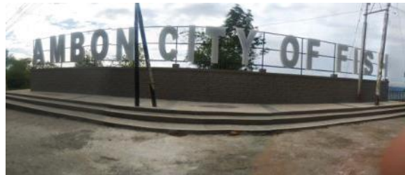
Gambar 13. Landmark Ambon City of Fish