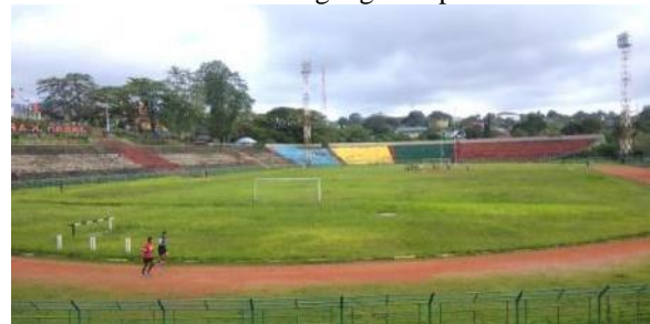
Gambar 15. Lapangan Mandala

Taman Karang Panjang dan Lapangan Mandala yang terletak saling berdekatan menempati urutan kesembilan dan kesepuluh dalam survei. Dalam sebulan terakhir, Taman karang panjang dikunjungi tujuh responden dan Lapangan Mandala dikunjungi oleh enam responden. Urutan terakhir dalam survei ditempati oleh Monumen Pahlawan Nasional dari Maluku yang dalam sebulan terakhir tidak dikunjungi sama sekali oleh responden.