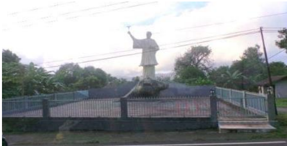
Gambar 10. Monumen St. Fr. Xaverius