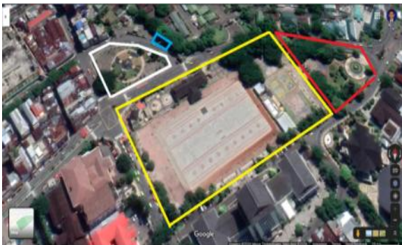
Gambar 5. Penampangan citra satelit dari Lapangan Merdeka (garis kuning), Taman Pattimura (garis merah), Gong Perdamaian Dunia (garis putih), dan Landmark Ambon City of Peace (garis biru).

Dalam sebulan terakhir, Monumen dr. Johannes Leimena dikunjungi oleh 24 responden dan Pantai Amahusu yang direvitalisasi oleh Dinas PUPR Kota Ambon sejak tahun 2019 serta diresmikan Wali Kota Ambon pada 1 Februari 2020 bertepatan dengan launching Ambon Visit 2020 dikunjungi oleh 23 responden.