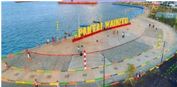
Gambar 11. Pantai Wainitu