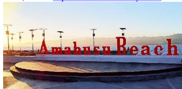
Gambar 7. RTP Pantai Amahusu

Urutan ketujuh ditempati oleh Pantai Wainitu yang dikunjungi oleh 13 responden. Pantai Wainitu dibangun oleh Balai Wilayah Sungai Maluku dan diresmikan oleh Menteri Keuangan dan Menteri PUPR pada Januari 2019. Monumen Martha Ch. Tjihahu dan Landmark Ambon City of Fish dikunjungi oleh delapan responden dalam sebulan terakhir dan menempati urutan kedelapan.