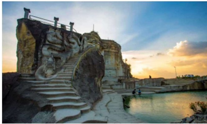
Gambar 1. Taman Tebing Breksi

Selain Tebing Breksi, Kalurahan Sambirejo memiliki beragam potensi wisata lain yang dikelola baik oleh pemerintah daerah maupun masyarakat secara mandiri. Potensi tersebut mencakup wisata alam, budaya, kesenian, kuliner, kerajinan tangan, hingga wisata edukasi. Adapun beberapa potensi yang berkembang di Kalurahan Sambirejo antara lain sebagai berikut: