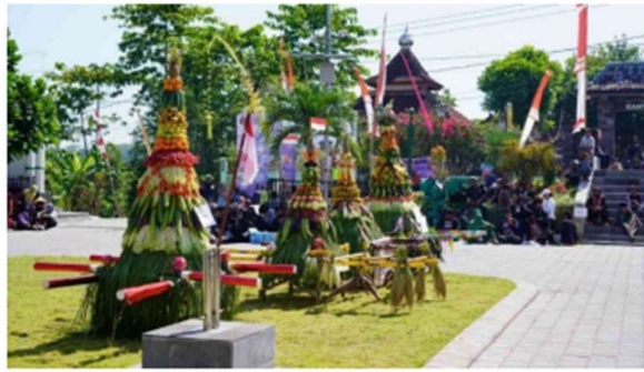
Gambar 3. Merti Desa Sambirejo

Potensi kesenian di masyarakat Kalurahan Sambirejo memiliki beberapa bentuk kesenian tradisional seperti pada Gambar 4 yaitu kesenian jathilan, Selain itu terdapat seni tari, ketoprak, dan hadroh. Kesenian tersebut sering ditampilkan dalam kegiatan budaya maupun acara masyarakat sehingga turut mendukung pengembangan wisata berbasis budaya lokal.