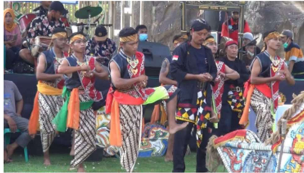
Gambar 4. Jathilan Kudho Song Pace (Sambirejo)

Potensi kesenian di masyarakat Kalurahan Sambirejo memiliki beberapa bentuk kesenian tradisional seperti pada Gambar 4 yaitu kesenian jathilan, Selain itu terdapat seni tari, ketoprak, dan hadroh. Kesenian tersebut sering ditampilkan dalam kegiatan budaya maupun acara masyarakat sehingga turut mendukung pengembangan wisata berbasis budaya lokal.