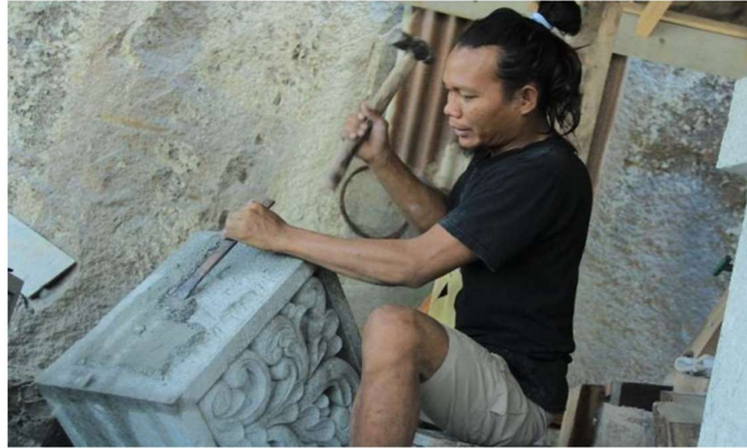
Gambar 6. Ukiran Batu Breksi

berkembang sebagai bentuk pemanfaatan sumber daya lokal sekaligus menjadi produk pendukung pariwisata.