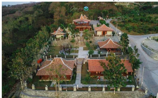
Gambar 7. Homestay Balkondes Sambirejo Sumber : Staff Kalurahan Sambirejo, 2025

Potensi homestay dan wisata edukasi merupakan daya tarik selain wisata alam dan budaya, masyarakat juga mulai mengembangkan homestay yang ditunjukkan pada Gambar 7 dan wisata edukasi sebagai bagian dari pelayanan wisata berbasis masyarakat. Pengembangan fasilitas tersebut diharapkan dapat mendukung pengalaman wisatawan sekaligus meningkatkan keterlibatan masyarakat dalam pengelolaan desa wisata.