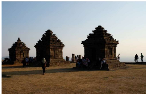
Gambar 2. Candi Ijo

Potensi wisata alam di Kalurahan Sambirejo meliputi Air Terjun Tritis, Goa Nepen, Spot Riyadi, Embung Pandanrejo, Embung Sumberwatu, Arca Gupolo, Arca Ganesha, serta beberapa kawasan cagar budaya seperti pada Gambar 2 yaitu Candi Ijo, Candi Barong, Candi Miri, dan Candi Dawangsari. Keberadaan destinasi tersebut menunjukkan bahwa Kalurahan Sambirejo memiliki daya tarik wisata berbasis alam dan sejarah yang cukup beragam.