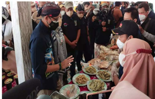
Gambar 5. Keripik Sayur UMKM Sambirejo

Potensi kuliner dan produk lokal yang berkembang di Kalurahan Sambirejo berdasarkan Gambar 5 yang di antaranya keripik sayur serta minuman tradisional berbahan empon-empon. Produk tersebut menjadi salah satu bentuk usaha masyarakat yang mendukung sektor ekonomi kreatif berbasis pariwisata.