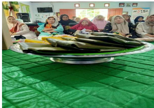
Gambar 8. Aneka Kue Tradisional

Kebutuhan pelatihan akan standar layanan makanan dan minuman baik dari segi produksi makanan dan minuman maupun dalam konteks kemasan perlu keterlibatan unsur yang terkait demi tercapainya standar kuliner yang sesuai dengan kebutuhan akan wisatawan yang aman untuk dikonsumsi dan membawa kenangan yakni pada kemasan yang perlu mendapatkan pelatihan.