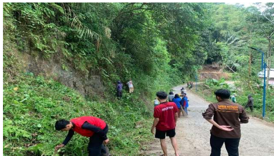
Gambar 1. Kerja Bakti Membersihkan Lokasi Objek Wisata, 2024

Selain itu, pada pelaksanaan kegiatan pengabdian kepada masyarakat terdapat beberapa agenda kegiatan dalam pelaksanaan kegiatan di Desa Pao di antaranya adalah melaksanakan kegiatan kebersihan pada sejumlah objek wisata agar memberikan kesan bersih di lokasi wisata.