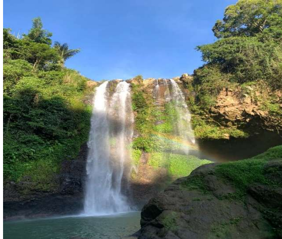
Gambar 5. Air Terjun di Desa Pao, Kabupaten Gowa

Pada umumnya kegiatan analisis kebutuhan pelatihan ini mendapat respon sangat positif dari pihak perangkat Desa Wisata Pao beserta masyarakat setempat untuk segera berkegas mempersiapkan wilayahnya menjadi pusat unggulan potensi produk wisata yang akan menjadi alternatif kunjungan wisata yang sangat menarik mengingat terdapat potensi alam yang dimiliki dengan terdapat air terjun.