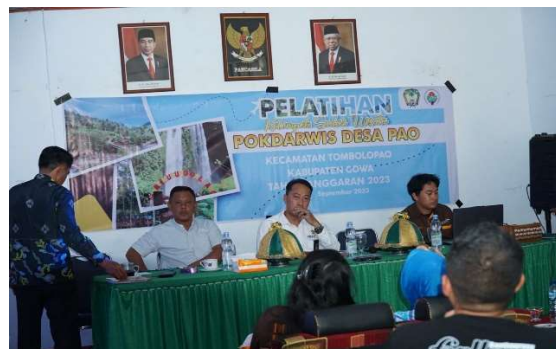
Gambar 10. Foto Pelatihan Pokdarwis

Hal yang perlu dilakukan pelatihan kuliner adalah dengan mengadakan pelatihan pengemasan makanan dan minuman bekerja sama dengan instansi terkait yakni meliputi bidang UMKM. Seperti juga dijelaskan bahwa pariwisata secara umum menjelaskan dari segenap aktifitas yang dilakukan oleh pemerintah dan stakeholder yang ada yang didukung oleh masyarakat dalam rangka memberikan layanan kepada para pengunjung di lokasi desa wisata secara berkelanjutan (Hawing et al., 2019).