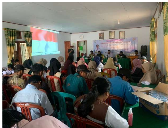
Gambar 4. Proses Kegiatan FGD di Desa Pao Kabupaten Gowa

Kegiatan ini akan terus dilaksanakan berdasarkan hasil FGD untuk ditindaklanjuti dengan melakukan pendampingan oleh Politeknik Pariwisata Makassar dengan berdasarkan pada hasil keputusan FGD yang akan dijadikan dasar pelaksanaan kegiatan selanjutnya. Pada pelaksanaan kegiatan FGD tersebut dihadiri oleh masyarakat, pelaku usaha dan pemerintah dalam rangka mencari masukan dan kebutuhan akan pelatihan dan kelompok kerja yang nantinya akan dilaksanakan pada kegiatan selanjutnya.