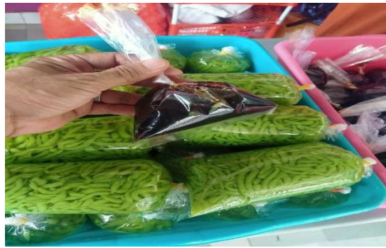
Gambar 9. Kemasan Kuliner

Hal yang menjadi prioritas utama dalam usaha kuliner adalah memberikan pelatihan tentang bagaimana mengemas makanan yang aman dan nyaman bagi pelanggan atau pengunjung ke Desa Wisata Pao. Harapannya adalah bahwa kuliner khas yang dimiliki oleh Desa Pao dapat dijadikan oleh-oleh kepada pengunjung atau wisatawan yang berkunjung. Apabila kuliner yang ada memiliki cita rasa yang enak dan juga dikemas dengan kemasan menarik maka pasti pengunjung atau wisatawan tertarik untuk membeli hasil produk kuliner tersebut. Sehingga masyarakat Desa Pao akan merasakan manfaatnya dengan adanya tambahan penghasilan dari usaha kuliner.