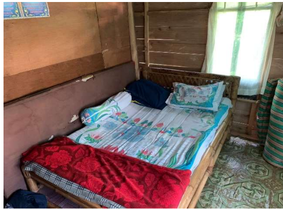
Gambar 7. Kamar dalam Homestay

Gambar 7 memperlihatkan bahwa pengelolaan homestay diperlukan penanganan dan pelatihan yang berbasis pada kebutuhan masyarakat pelaku usaha di Desa Wisata Pao. Hal ini menjadi prioritas utama mengingat kunjungan wisatawan akan berdampak pada tingkat hunian homestay yang ada di Desa Wisata Pao.