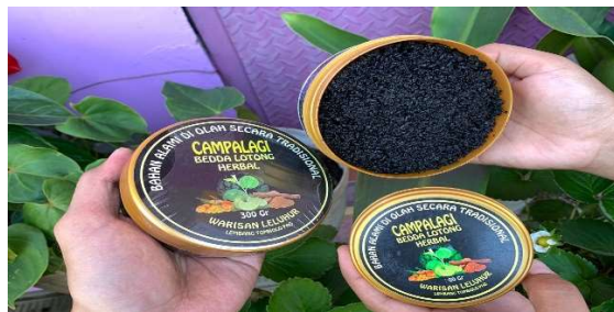
Gambar 6. Bedda Lotong

Adapun rumah produksi yang perlu dilakukan pelatihan bagi pelaku usaha wisata di antaranya rumah produksi kerajinan souvenir, tempat pembuatan aneka sajian makanan dan minuman yang akan dilakukan pelatihan dengan mengedepankan konsep hygiene dan sanitasi makanan. Hal yang juga menarik di Desa Wisata Pao adalah pembuatan “bedda lotong” yang perlu mendapatkan pelatihan utamanya dari segi legalitas produksi serta proses pembuatan yang mana nantinya para pengunjung dapat langsung menuju ke tempat pembuatannya.