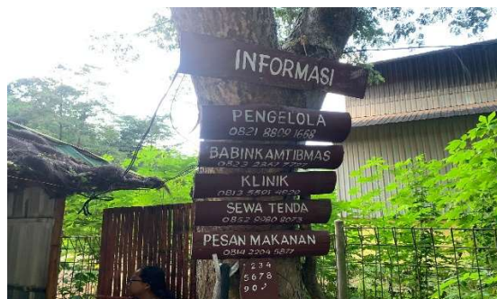
Gambar 2. Papan Informasi di Lokasi Desa Wisata Pao, 2024

Dalam proses kegiatan kerja bakti memberikan penyadaran kepada masyarakat tentang arti pentingnya kebersihan dan kenyamanan dalam menjaga destinasi wisata yang berbasis lingkungan yang bersih dan nyaman bagi pengunjung. Kegiatan aksi pemasangan papan informasi sebagai bentuk aksi dalam memberikan informasi di lokasi destinasi wisata yang menjadi pusat kunjungan di wilayah atraksi wisata.