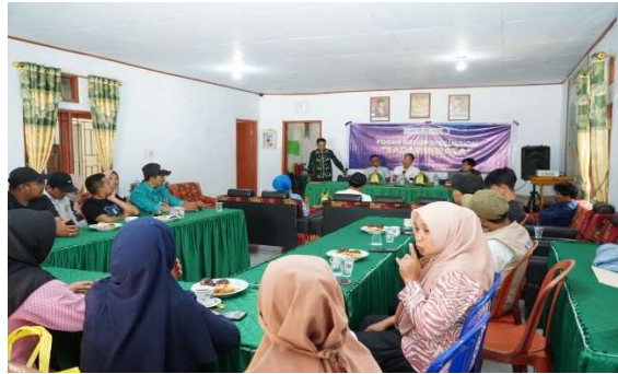
Gambar 3. Pelaksanaan FGD di Desa Pao, 2024

Kegiatan ini akan terus dilaksanakan berdasarkan hasil FGD untuk ditindaklanjuti dengan melakukan pendampingan oleh Politeknik Pariwisata Makassar dengan berdasarkan pada hasil keputusan FGD yang akan dijadikan dasar pelaksanaan kegiatan selanjutnya. Pada pelaksanaan kegiatan FGD tersebut dihadiri oleh masyarakat, pelaku usaha dan pemerintah dalam rangka mencari masukan dan kebutuhan akan pelatihan dan kelompok kerja yang nantinya akan dilaksanakan pada kegiatan selanjutnya.