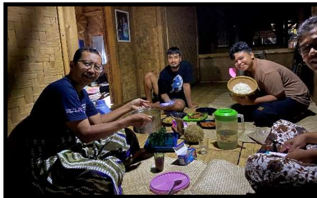
Gambar 5: Merasakan kehangatan sembari makan malam

Di Baduy, bagi pengunjung yang berkunjung bukan hanya sebatas mengamati, namun akan merasakan pengalaman mendalam ( deep experiences ). Masyarakat Baduy dengan keramahannya membuka pintu bagi pengunjung untuk terlibat langsung dalam berbagai kegiatan sosial mereka. Salah satu daya tarik yang tidak terlupakan adalah kesempatan bagi mereka yang berminat untuk merasakan dan memahami proses pembuatan kerajinan tangan khas Baduy. Dalam setiap sentuhan dan langkah dalam pembuatan kerajinan, ada cerita, tradisi, dan nilai-nilai budaya yang terkandung di dalamnya.