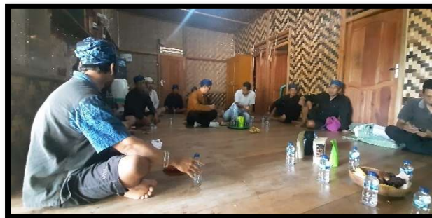
Gambar 7: Pelatihan Tata Kelola Kelembagaan dan Paket Wisata