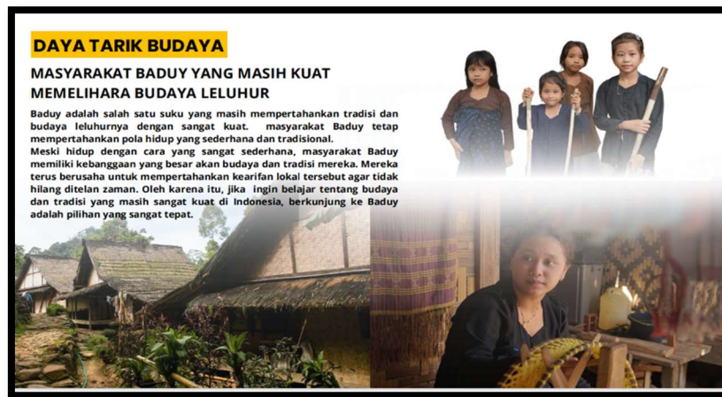
Gambar 2: Pesona Budaya Saba Baduy

berinteraksi secara langsung dengan masyarakat setempat. Selain itu ada banyak kegiatan yang dapat dilakukan. Bagi yang memiliki minat dalam kerajinan tangan, ada peluang untuk belajar dan mencoba membuat berbagai kerajinan khas. Setiap objek yang dihasilkan bukan hanya sebagai produk komersial, tetapi juga sebagai ekspresi budaya dan nilai-nilai masyarakat Baduy yang mendalam.