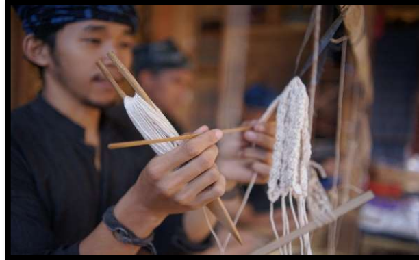
Gambar 4: Atraksi pembuatan gelang Baduy

Pemerintah Desa Kanekes, tahun 2023 mencatat ada sekitar 75.972 pengunjung. Ini artinya, rata-rata per bulan Baduy menerima kunjungan 6.000 orang. Waktu kunjungan umumnya pada saat musim liburan dan akhir pekan. Beberapa pengunjung mengungkapkan kebanyakan dari mereka datang dengan rekomendasi dari teman atau keluarga yang sudah pernah mengunjungi Baduy sebelumnya, menandakan bahwa rekomendasi pribadi memainkan peran dalam mempengaruhi keputusan orang lain untuk mengunjunginya.