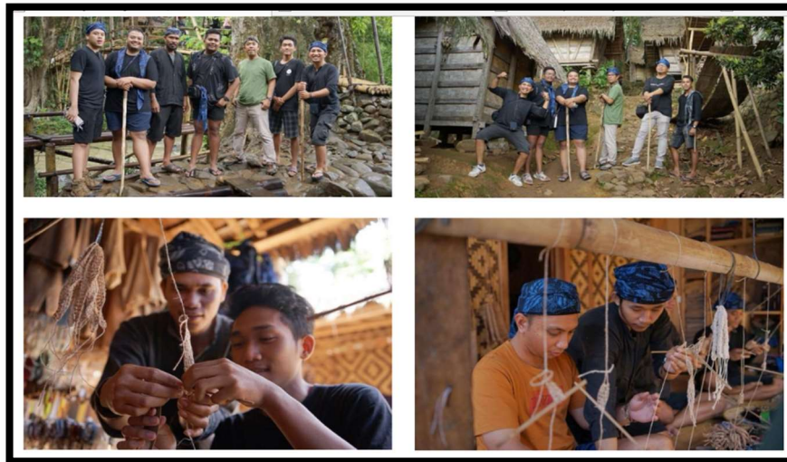
Gambar 11: Pengunjung terlibat dalam aktivitas bersama orang lokal

Secara ringkas kegiatan yang dijalankan para pengunjung selama setengah hari di Baduy, antara lain: edukasi mengenai budaya kopi dengan tujuan menjelaskan ke pengunjung tentang proses pengolahan kopi dengan metode tradisional, edukasi penggunaan pewarna alam untuk produk kreatif tujuannya memberikan wawasan tentang penggunaan bahan-bahan alami dalam kerajinan tradisional, serta kegiatan edukasi menenun untuk mengenali lebih dekat budaya tenun yang telah menjadi warisan turun-temurun di masyarakat Baduy. Sebagai pelengkap, rombongan peserta test tour diberikan makan siang ala Baduy. Acara ini menjadi momentum interaksi lebih lanjut tentang kuliner lokal. Kegiatan berakhir dengan sesi menikmati durian, simbol kekayaan alam Baduy. Kegiatan test-tour juga meminta para peserta memberikan review. Dapat disimpulkan bahwa kegiatan ini berhasil memberikan wawasan bagi pengunjung secara mendalam tentang budaya Baduy. Namun demikian beberapa kekurangan yang masih dijumpai untuk dilakukan pembenahan ke depannya, antara lain: