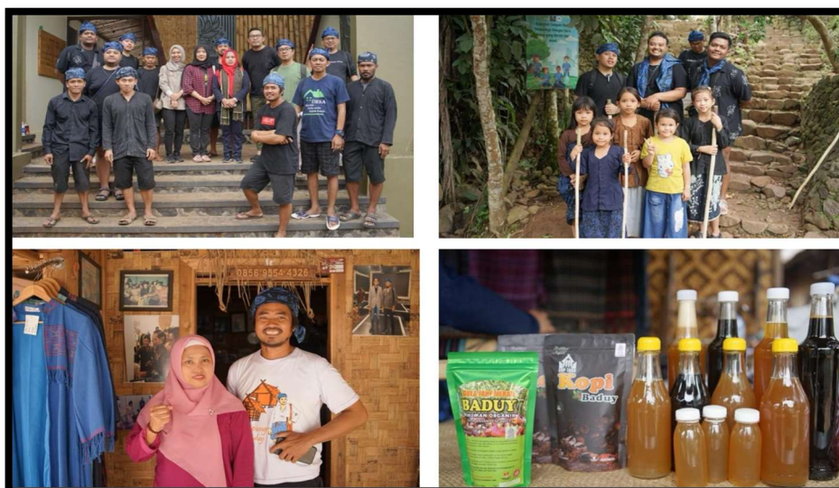
Gambar 12: Pengunjung bersama warga dan produk lokal Baduy