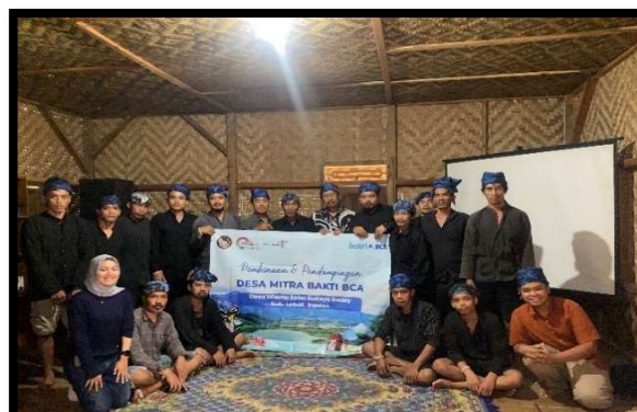
Gambar 6: Kegiatan saat usai FGD

Untuk menghasilkan program pendampingan yang efektif, tim pendamping merancang bersama peserta dampingan serangkaian kegiatan. Pertama , diawali assesmen lapangan yang dilakukan dengan metode observasi, wawancara sambil lalu dengan melibatkan beberapa tokoh adat selama proses pengamatan dan pengenalan potensi di wilayah dampingan. Hasil dari assesmen tersebut selanjutnya dijadikan awal dalam forum diskusi terarah yang melibatkan stakeholder lokal dan pihak terkait. Forum diskusi dilaksanakan bulan Juni 2023 bertujuan menyusun strategi dan langkah-langkah implementasi yang efektif. Kesimpulannya, tim pendamping merancang serangkaian pelatihan yang diadakan setiap bulannya.