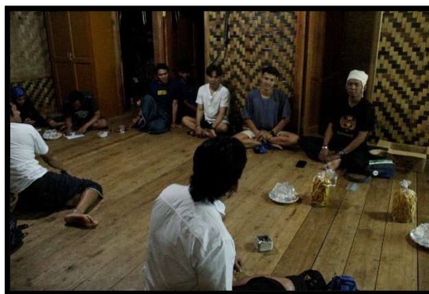
Gambar 10: Pelatihan Pelayanan Prima & Manajemen Imah

Ketiga , pemberian pendampingan. Pasca kegiatan pelatihan yang secara bertahap sudah diberikan, selanjutnya tim DWI secara khusus mengalokasikan waktunya untuk mendampingi masyarakat Saba Budaya Baduy selama 10 hari. Tim DWI yang melakukan pendampingan memiliki tugas memastikan berbagai pelatihan yang sudah diberikan dapat diterapkan di lapangan. Berbagai rangkaian pendampingan termasuk di dalamnya kegiatan monitoring dan evaluasi, termasuk memberikan pendampingan untuk persiapan uji coba paket wisata yang sudah dirumuskan. Selama 10 hari tinggal bersama di Baduy, pihak DWI secara berproses mengerjakan beberapa kegiatan bersama, antara lain: