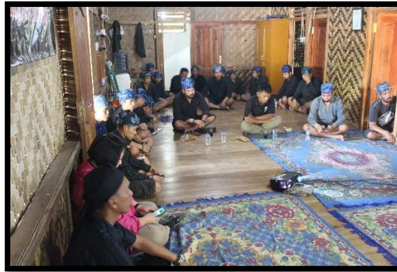
Gambar 8: Pelatihan Kepemanduan dan Tata Kelola Administrasi