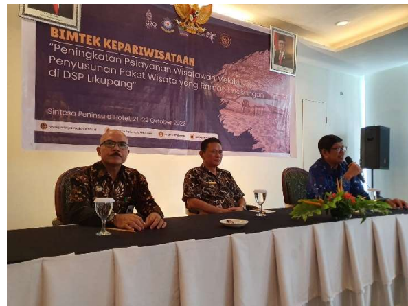
Gambar 1. Pembukaan Bimtek Kepariwisataan

kegiatan Bimtek yang digelar oleh Politeknik Pariwisata Makassar bekerja sama dengan Pemerintah Minahasa Utara berjalan dengan baik tanpa hambatan dan kendala.