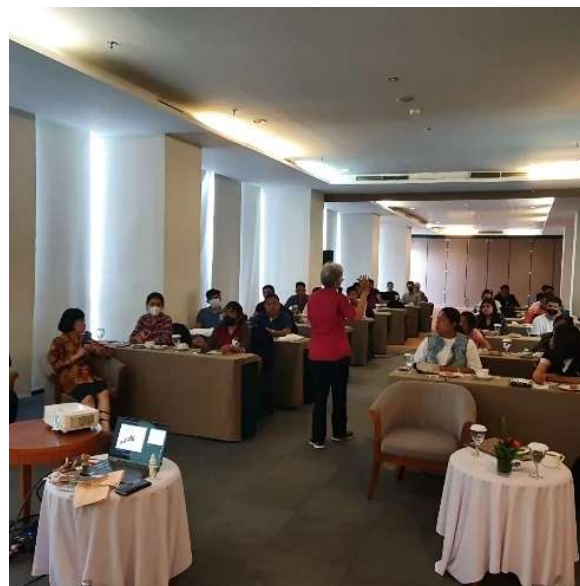
Gambar 6 . Meteri Story Telling