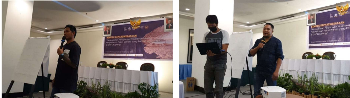
Gambar 7. Peserta Melakukan Demonstran di kelas untuk mempersentasikan rancangan Paket Wisata dengan menyampaikan Narasi Story Telling setiap objek

Materi tentang “ Story Telling ” diawali dengan memberikan “ Game Puzzle ” kepada peserta BIMTEK. Pemateri (Matriks 1) mengungkapkan bahwa tujuan “ Game Puzzle ” ini untuk memberi penguatan kepada peserta untuk mampu mengaitkan, mengidentifikasi dan mendeskripsikan antara persoalan global dan masalah lokal, mencari perbedaaan, kesamaan atau hubungan keduanya, lalu mencari solusi berupa gagasan secara deskripsi. Misalnya Permasalahan global tentang kekeringan, peserta akan mencari tema yang sesuai dengan kondisi lokal di Likupang. Dengan cara ini, akan menggiring opini peserta dan menumbuhkan sikap kritis pada isu-isu global di lingkungan sekitar. Hal ini sangat diperlukan untuk menjadi bahan ketika mendampingi wisatawan mancanegara. Pada tahap awal, konsep dan pengantar “ Story Telling ” disampaikan dalam bentuk ceramah dengan bantuan media proyektor dan powerpoint untuk menyajikan contoh-contoh argumentasi “ Story Telling ” .