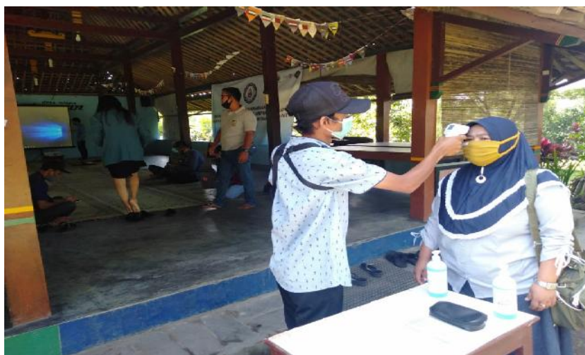
Gambar 4. SOP penanganan pengunjung berupa cek suhu tubuh

Pada lingkup ini, trainer lebih berperan sebagai konsultan dan fasilitator yang memberikan anjuran dan jejaring untuk menyiapkan berbagai fasilitas pendukung penerapan CHSE. Hasil pendampingan menunjukan bahwa terdapat perbedaan yang sangat jelas, pada saat sebelum dan setelah pendampingan.