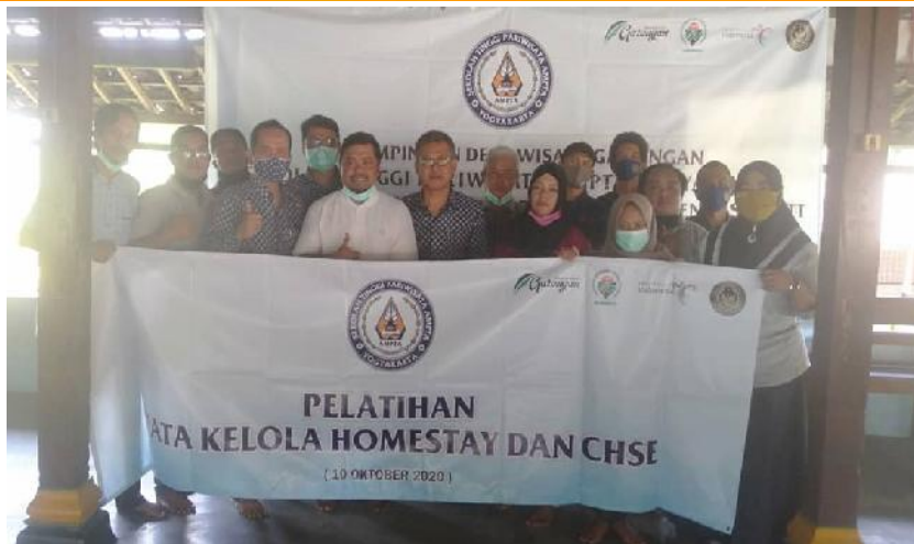
Gambar 3. Dokumentasi Pelatihan CHSE

Sehingga mendapatkan data-data yang komprehensif terkait dengan kondisi protokol kesehatan CHSE saat ini, dan kemudian data data tersebut kita gunakan untuk menyusun rencana – rencana kegiatan sekaligus untuk menyusun materi - materi pelatihan yang akan disampaikan kepada para pengurus dan masyarakat yang etrlibat secara langsung dalam kegitan Desa Wisata Garongan dari beberapa unsur yang ada.