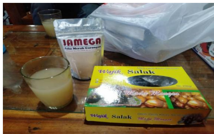
Gambar 7. Olahan produk lokal berbahan baku hasil pertanian

Paket wisata di desa wisata garongan ini juga menawarkan paket wisata edukatif yaitu berupa belajar berkebun salak, belajar lebih dekat mengenai cara penanaman salak, serta belajar untuk mengetahui cara memanen salak dengan benar sehingga tidak tertusuk duri. Dalam konsep pelatihan yang diberikan yaitu memberikan edukasi terhadap para pelaku wisata terutama pada bagian paket wisata di perkebunan ini yaitu dengan durasi waktu dalam kebun itu sendiri karena durasi akan memberikan efektivitas waktu kunjungan dan waktu pembelajaran bagi wisatawan.