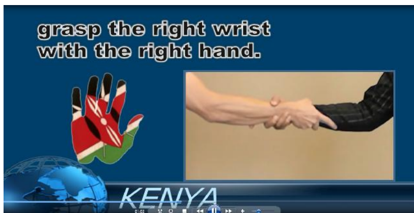
Gambar 9. Contoh Etika greeting dari negara Australia dan Kenya

Selanjutnya untuk mengetahui sejauh mana materi ini dapat diterima peserta pelatihan, maka pelatih memberikan kesempatan kepada para pemandu lokal di destinasi Desa Wisata Garongan untuk menanggapi dan memberikan komentar setiap kali video tersebut ditayangkan. Dengan model presentasi seperti ini, peserta pelatihan dapat merespon dengan fokus memperhatikan dan tampak langsung mempraktikkan dengan kerabat yang duduk di sampingnya tanpa menunggu intruksi. Tampak salah seorang peserta pelatihan tersenyum melihat cara greeting dari negara lain yang tampak aneh dilakukan. Berikut adalah contoh gambar greeting etique dari beberapa negara asing yaitu: