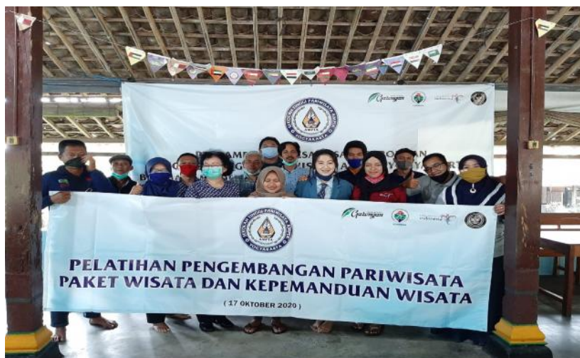
Gambar 5. Dokumentasi Pelatihan Pengembangan Pariwisata Paket Wisata dan Kepemanduan

Pada hari Selasa tanggal 17 Oktober 2020 telah dilaksanakan program nyata pendampingan masyarakat desa wisata, berupa pelatihan pengembangan produk wisata, khususnya paket wisata di desa wisata Garongan (Surat Tugas Nomor: 397c/LPPM-AMPTA/X/2020), dan dihadiri oleh orang, sebagai wujud nyata pendampingan di desa wisata dengan tujuan memberdayakan masyarakat di desa wisata Garongan.