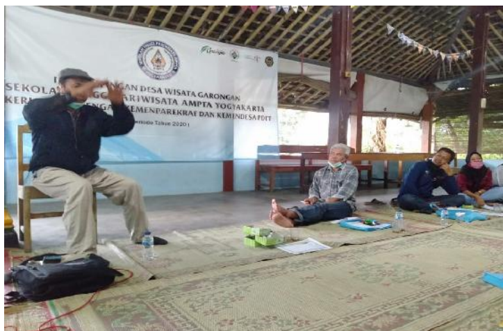
Gambar 10. Suasana memberikan pelatihan pengelolaan keuangan

Walaupun bisnis desa wisata sangat prospektif, namun bisnis pariwisata merupakan jenis bisnis yang sangat fluktuatif. Fluktuatif berarti banyak gejolak, bisnis bisa cepat naik signifikan dan bisa juga turun drastis dalam sekejap. Fluktuasi pasar wisata juga sangat tergantung pada tingkat daya beli konsumen, isu politik, isu keamanan, transportasi, event/ liburan, gejolak ekonomi dan lain sebagainya, seperti pada saat ini terkait dengan adanya pandemi Covid-19. Perubahan-perubahan atau gejolak tersebut setiap saat akan mempengaruhi pencapaian keuntungan desa wisata.