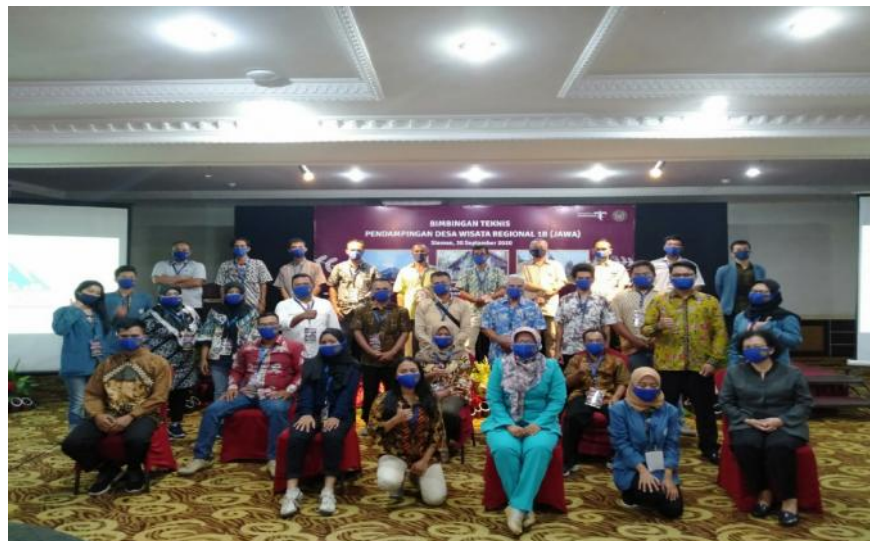
Gambar 1. Dokumentasi Bimtek Pendampingan Desa Wisata oleh STP AMPTA

Kegiatan Bimtek Pendampingan Desa Wisata Regional 1B (Jawa) telah sukses dilaksanakan oleh Sekolah Tinggi Pariwisata AMPTA Yogyakarta (STP AMPTA) difasilitasi Kementerian Pariwisata dan Ekonomi Kreatif (Kemenparekraf)/Badan Pariwisata dan Ekonomi Kreatif. Adapun peserta Bimtek merupakan pelaku wisata di Desa Wisata Garongan yang merupakan mitra program pendampingan.