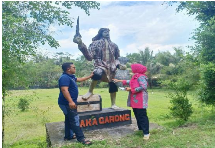
Gambar 6. Patung Jaka Garong sebagai ikon wisata

Jaka Garong ini menjadi sosok inspiratif yang memberikan nama Desa Wisata Garongan. Konsep Desa Wisata Garongan mengangkat tema pemanduan wisata tentang Jaka Garong.