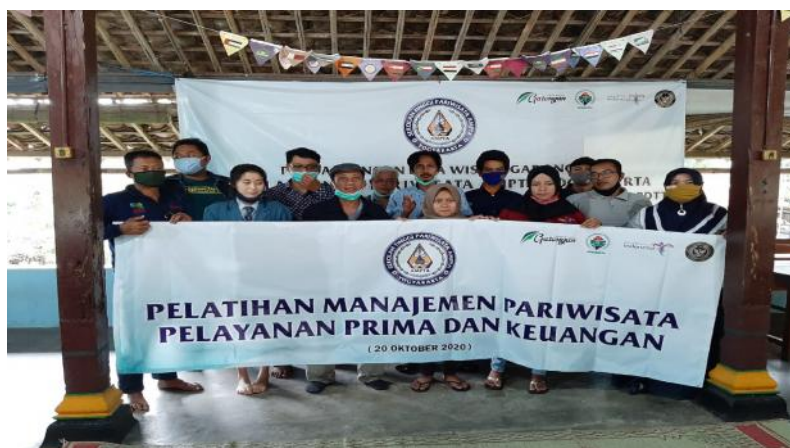
Gambar 2. Dokumentasi pelatihan pelayanan prima

Kualitas pelayanan merupakan ukuran seberapa bagus tingkatan layanan yang diberikan mampu sesuai dengan ekspektasi pelanggan artinya kualitas pelayanan artinya kebutuhan dan keinginan tamu atau pengunjung yang di tentukan perusahaan.