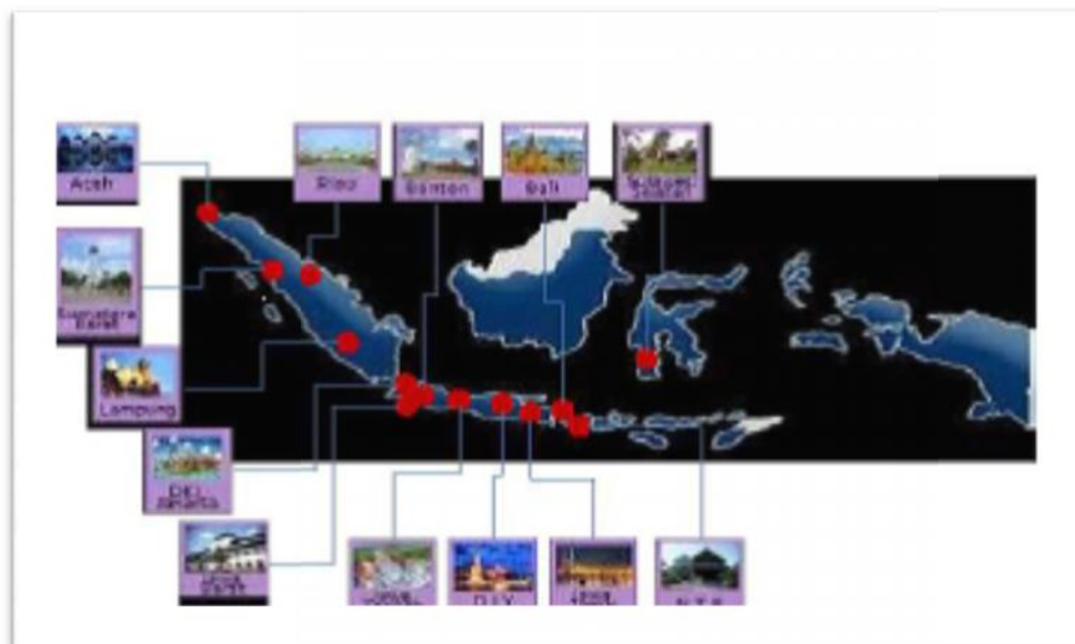
Gambar 2. Sebaran Destinasi Wisata Syariah di Indonesia

Berdasarkan beberapa pengertian diatas, maka dapat disimpulkan bahwa destinasi pariwisata adalah suatu wilayah yang mempunyai keunikan dan keunggulan yang mampu membuat wisatawan berkunjung ke tempat tersebut untuk beberapa waktu dan memiliki fasilitas-fasilitas yang mendukung kegiatan pariwisata. Destinasi wisata di Indonesia tersebar di berbagai wilayah Indonesia, disebabkan Indonesia memiliki keunggulan dan keunikan serta fasilitas yang memadai untuk melaksanakan kegiatan pariwisata. (Zaky MLubis, 2018)