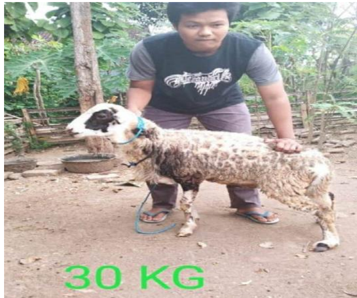
Gambar 3. Perawatan Kambing https://raudatuljannah.com/kambing-qurban/

Semua proses yang dilakukan selalu bekerja sama dengan pihak-pihak yang dianggap mumpuni dibidangnya. Seperti proses perawatan kambing ini juga bekerja sama dengan Departemen Ilmu Bedah dan Rafiologi FKH UGM. Santri diajarkan bagaimana merawat kesehatan kambing, kemudian bagaimana menjaga kebersihan kandang dan lingkungan sekitar akandang serta bagaimana menjaga kepadatan ternak dalam setiap kandang yang ada.