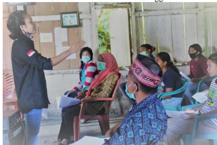
Gambar 3 pelatihan Bahasa Inggris