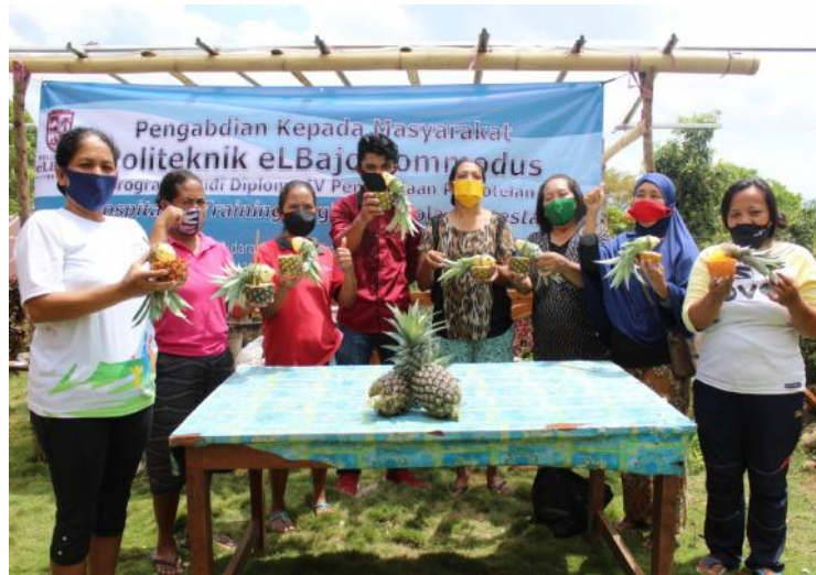
Gambar 1 pelatihan membuat pinacolada