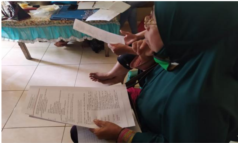
Gambar 4 pelatihan Bahasa Inggris

Kegiatan pendampingan ini merupakan solusi yang diberikan oleh tim dosen terhadap masalah yang dihadapi oleh para pengelola homestay di Desa Liang Ndara. Para peserta sangat antusias dalam mengikuti kegiatan pelatihan Bahasa Inggris ini. Rentang usia peserta yang mengikuti kegiatan pelatihan ini didominasi oleh peserta dengan usia 40 tahun ke atas. Tim dosen memberikan treatment khusus sehingga tujuan dari kegiatan pelatihan Bahasa Inggris ini dapat tercapai. Para peserta mengatakan bahwa mereka mengalami kesulitan jika harus belajar menulis kata-kata dalam Bahasa asing, maka tim dosen pun memutuskan bahwa pelatihan ini dikhususkan untuk meningkatkan keterampilan berbicara dalam Bahasa Inggris saja. Para peserta diajarkan untuk dapat mengucapkan kata dan kalimat Bahasa Inggris dengan benar dan menunjukkan gesture yang tepat dalam berkomunikasi.