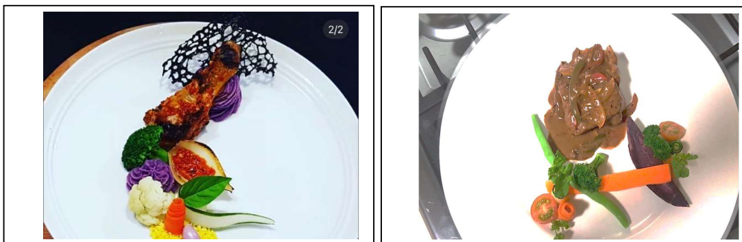
Gambar 4. Hasil Plating Mahasiswa

Variasi ini mencerminkan perbedaan tingkat pemahaman prinsip plating antar mahasiswa. Nugroho et al. (2024) menegaskan bahwa kreativitas plating mahasiswa berkembang melalui praktik berulang dan bimbingan instruktur. Dengan demikian, temuan ini menunjukkan bahwa latihan yang berulang dan demonstrasi visual dari instruktur berperan penting dalam meningkatkan konsistensi hasil plating mahasiswa. Secara keseluruhan, penerapan teknik plating kondimen ubi dalam praktikum main course menunjukkan bahwa mahasiswa telah mampu mengaplikasikan prinsip dasar plating , namun masih memerlukan penguatan pada aspek kontrol tekstur bahan dan pemahaman komposisi visual. Implikasinya, pembelajaran plating perlu menekankan keseimbangan antara penguasaan teknik dasar pengolahan dan prinsip estetika penyajian agar hasil plating lebih konsisten dan profesional. Berikut adalah hasil plating mahasiswa program studi perhotelan STP AMPTA Yogyakarta: