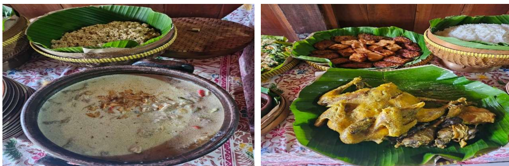
Gambar 2. Menu Kuliner Lokal Paket Ecowellness tour Desa Wisata Nglanggeran.