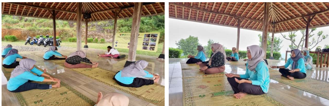
Gambar 3. Kegiatan Meditasi di Desa Wisata Nglanggeran.

Meditasi dalam paket ecowellness tour Desa Wisata Nglanggeran diselenggarakan di tempat terbuka, dengan arah view lansekap Gunung Api Purba Nglanggeran. Hal tersebut dilakukan agar wisatawan bisa merasakan sentuhan alam saat bermeditasi. Keberhasilan meditasi sangat dipengaruhi oleh faktor lingkungan sekitar yang akan membantu meningkatkan pemusatan pikiran (Wijaya et al., 2023). Desa Wisata Nglanggeran berada pada wilayah pedesaan yang termasuk dalam ketinggian sedang >400 mdpl sehingga memiliki iklim yang sejuk dan asri. Kondisi tersebut sangat mendukung untuk keberhasilan program meditasi. Lokasi desa yang jauh dari hiruk pikuk keramaian juga menjadi ekosistem yang nyaman untuk pelaksanaan program meditasi. Meditasi sangat digemari oleh wisatawan yang mencari ketenangan pikiran (Sukaatmadja et al., 2017). Kegiatan meditasi dalam paket ecowellness tour Desa Wisata Nglanggeran seperti tersaji dalam gambar 3.